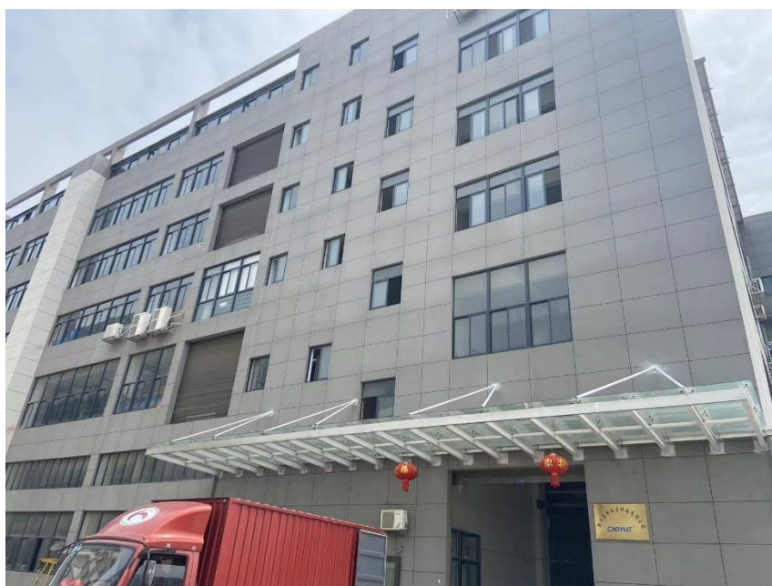
图 2-1 企业概貌

公司坐落于东海之滨、瓯江口畔，北临风景秀丽的旅游胜地雁荡山，距温州机场仅 30 余公里，旁靠七里港码头与甬台高速，交通十分便捷。公司遵循“以质量求生存、以科技求发展”的企业宗旨，开创一流企业、生产一流产品、提供一流服务。发展中的浙江东跃以更广阔的胸襟走向未来，竭诚期待与海内外有识之士携手合作，共创崭新的明天。